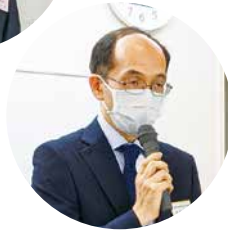
岩瀬県税事務所長